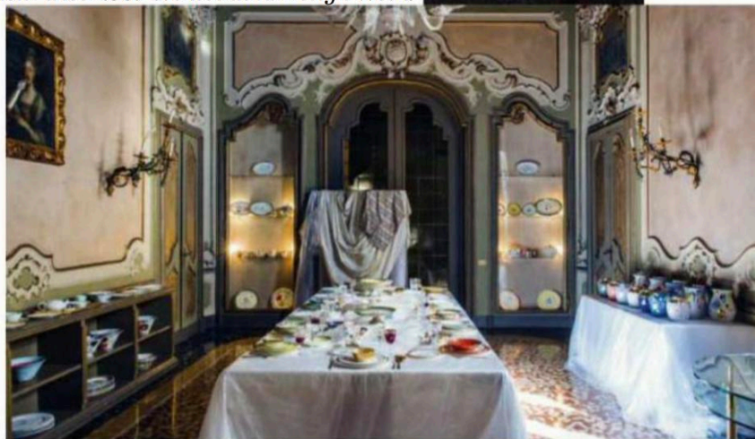
Las joyas de palacio. Los espléndidos espacios del Palazzo Visconti, que data del siglo XVII, exhibieron las nuevas vajillas de cerámica y porcelana de la creadora Coralla Maiuri.

Cada año resulta más difícil abarcar todo lo que uno quiere ver durante la Milan Design Week , y es que se pueden contar por cientos, casi por miles, los eventos que se suceden en la ciudad durante esta semana. En cada plaza, cada rincón, tienda, galería, palacio, fábrica, despacho de arquitectos o nave industrial, y hasta en un tranvía tiene lugar todo un derroche de diseño. En 2018 se consolida el nuevo Isola Design District como otro territorio a conquistar y se suma la novedad de curiosear las casas de arquitectos, interioristas y designers . Estos son nuestros favoritos, entre ellos, el distrito 5vie, como zona a no perderse con el Palazzo Litta, como una de sus grandes atracciones y el Oratorio della Passione en la Basilica di Sant'Ambrogio con la instalación >